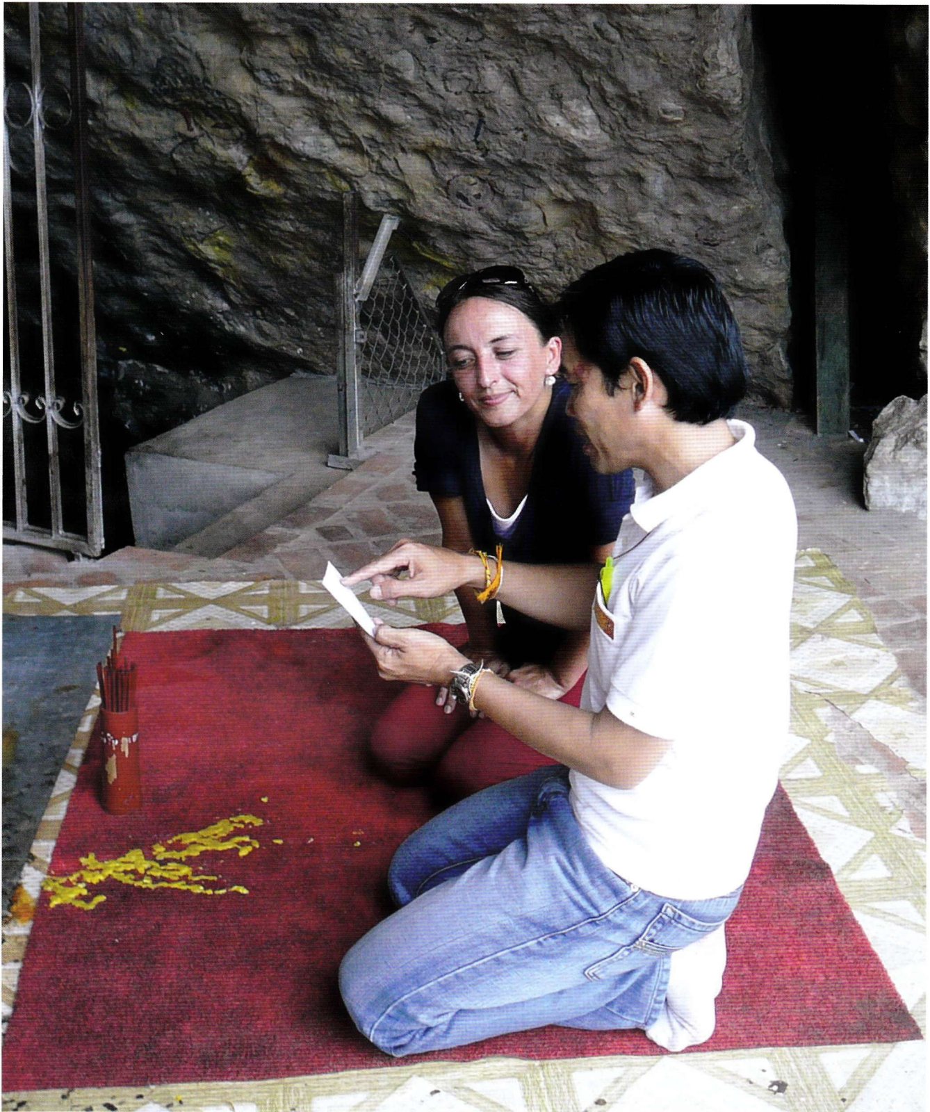
Wer sensibel auf das Gastland zugeht, öffnet sich auch neuen Erkenntnissen.